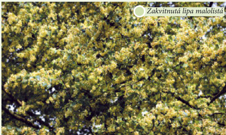
Zakvitnutá lipa malolistá