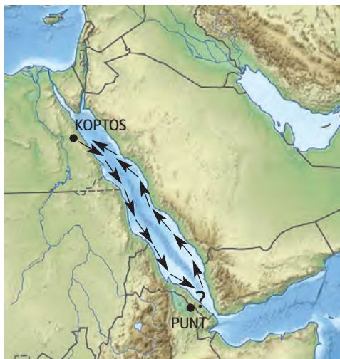
Možná trasa Henuovej výpravy

prístav pri dnešnom mestečku Vádí Gavis. Archeológovia v posledných rokoch identifikovali v lagúne starovekého prístavu dlhé prístavisko vytesané do koralového útesu. Hneď medzi prvými nálezmi sa našli čepele kormidlového vesla, kamenné kotvy či cédrové lodné dosky prevítané činnosťou morských červov.