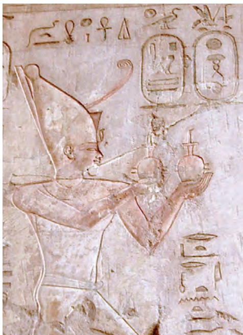
Psammetik I. na egyptskom reliéfe

Zrejme v sídelnom meste dynastie v Sais sa v druhej polovici 7. storočia Psammetikovi narodil syn a následník trónu Neko. Okrem otcovej prezieravosti dostal do vienka ďalekozrakosť v štátnických rozhodnutiach, vďaka ktorej mal v budúcnosti nemalou mierou prispieť k obrazu moderných historikov, ktorí sa