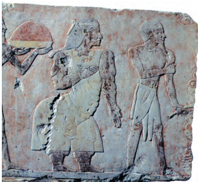
Kráľa Puntu Pareha (vpravo) sprevádza jeho manželka Ati (vľavo) na egyptskom reliéfe z 15. storočia pred n. l.

Máme viacero dobrých dôvodov sa domnievať, že Henuova loď sa úspešne vrátila k egyptskému pobrežiu i s vyťažným nákladom. Henu by sa iba ťažko chválil vo svojom nápise z Vádí Hamammátu vyslaním lode, ak by loď skončila na morskom dne. Čo je však ešte dôležitejšie, neúspech Henuovej misie by na dlhšie obdobie zatvoril dvere ďalším pokusom, čo je presný opak toho, ako sa situácia nakoniec vyvinula. Ukázalo sa, že Henuova expedícia otvorila Egypťanom nový svet a ďalšie výpravy mali zakrátko nasledovať. Egypťania dokonca na pobreží Červeného mora vybudovali za panovania dvanástej dynastie