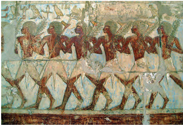
Egyptania na ceste do Puntu. Reliéf z Dér el-Bahrí.

V Henuovej správe sa nehovorí nič o type lode, ktorú Egyptania na juh vyslali, ani o jej veľkosti. V Egypte sa stavali viaceré typy lodí. Riečne lode rôznych veľkostí sa premávali dennodenne po Níle. Patrili k bežnému životu, lebo plavba po rieke bola najľahším spôsobom prepravy v krajine. Plavba na morskej hladine sa však s plavbou po rieke nedala porovnať. Na otvorenej vodnej ploche dorážali na lode vetry, morské prúdy, lode sa často bezmocne otriasali pod nárazmi vln a do toho z času na čas priburácali i silné smršte. Egyptania do týchto podmienok dlho posielali riečne lode používané na Níle. Boli to lode bez kýlu, teda práve bez tej časti trupu, ktorá by im prepožičala po-