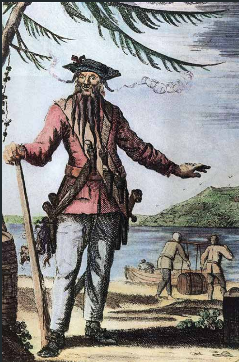
ANGLICKÝ PIRÁT EDWARD TEACH, KTORÉHO PREZÝVALI ČIERNOFÚZ, VYČÍŇAL V KARIBIKU V ROKOCH 1713-1718